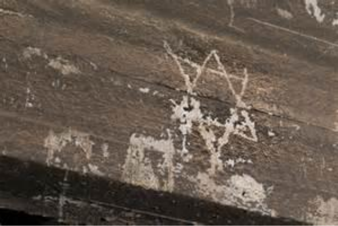
Les Milles, Graffiti